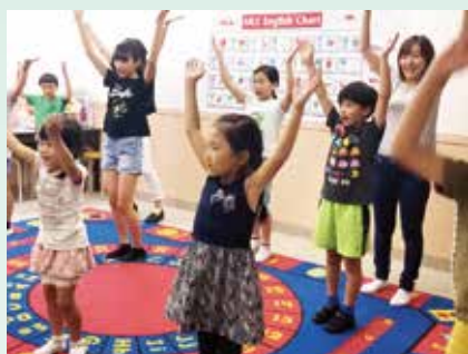
実際のリハーサルの雰囲気を実感できます

「合格した」という事実によって生徒たちに自信を持ってもらうためにオーディションを行います。参加者本人の「やる気」やディレクター（演出家）の指示にきちんと反応できるか、などが重視されます。